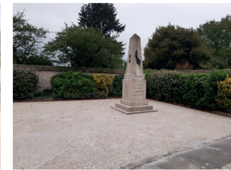
Réfection du parvis autour du monument aux morts