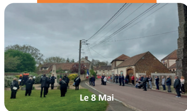
Le 8 Mai