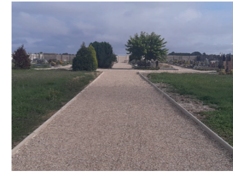
Réfection des allées et de l'accès au cimetière