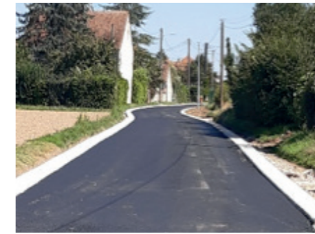
La rue des Charbonniers