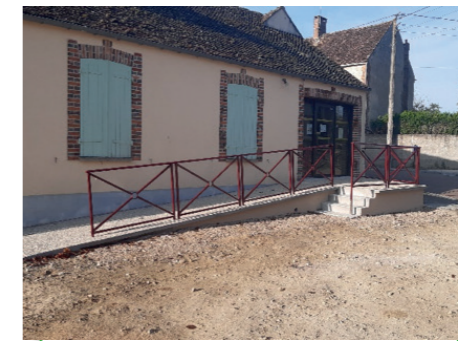
Réhabilitation de l'accès à la salle des fêtes