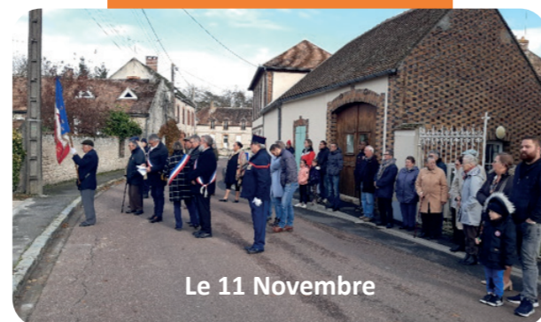
Le 11 Novembre