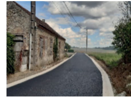
Réfection complète des routes sur Vauredennes : l'impasse du marchais rouge