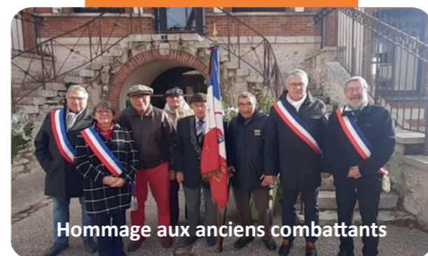
Hommage aux anciens combattants