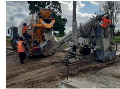
Les engins en actions, raboteuse de chaussée, et machine à couler les caniveaux.