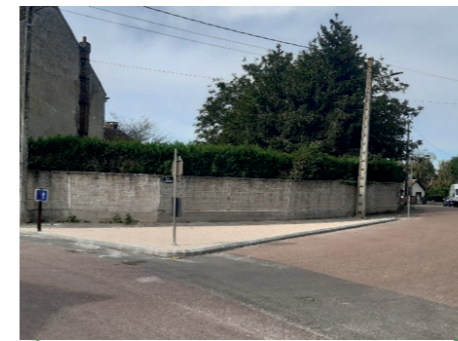
Réaménagement du carrefour de la rue des Granges